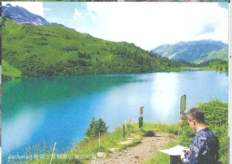
Jackman 在瑞士某個高山湖泊旁寫生